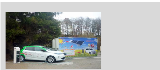
Fahrzeuge an Stromtankstellen