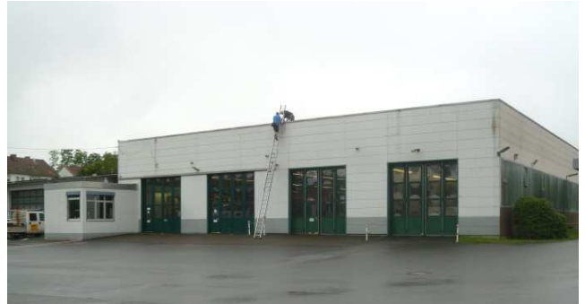
Hofansicht Werkstatthalle

Wellesweilerstraße 146 66538 Neunkirchen Telefon 06821/240244 Email: joerg.maurer@fsn-neunkirchen.de Internet: www.fsn-neunkirchen.de