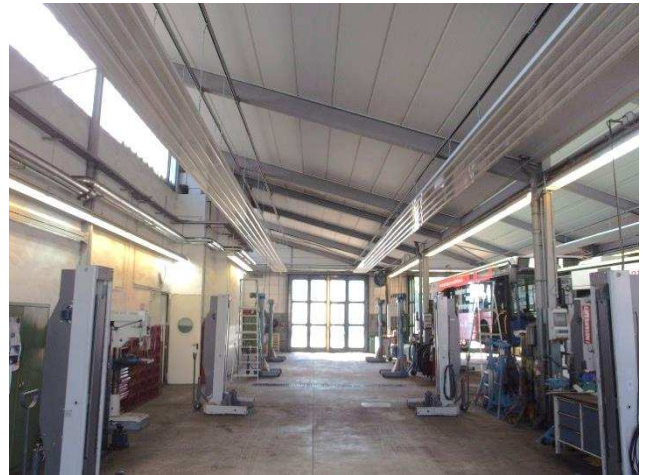
Werkstatt mit wassergeführten Deckenstrahlplatten

Die Firma FSN hat die Anlagentechnik in der Werkstatthalle modernisiert und energetisch optimiert. Neben dem gasbetriebenen Brennwertkessel mit zentralem Warmwasserspeicher wurde die Wärmeübergabe in der Werkstatt modernisiert. Dazu wurden die alten Luftheizungen durch effiziente Deckenstrahlplatten ersetzt. Diese geben Wärme überwiegend als Strahlung ab. Dadurch werden die umgebenden Oberflächen erwärmt, jedoch nicht primär die Luft. Dies ist, auch bedingt durch die hohen Luftwechselraten durch das häufige Öffnen der Tore, eine sehr effektive Beheizung der Halle. Trotz geringerer Lufttemperatur und niedrigerem Energieverbrauch ist die Behaglichkeit für die Mitarbeiter höher als vorher.